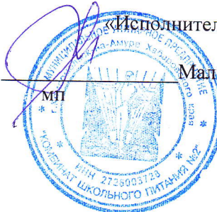
График оказания услуг